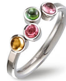
M | € 119,-