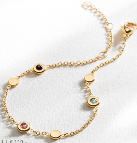
J | € 119,-