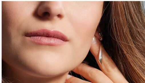
J | € 169,-