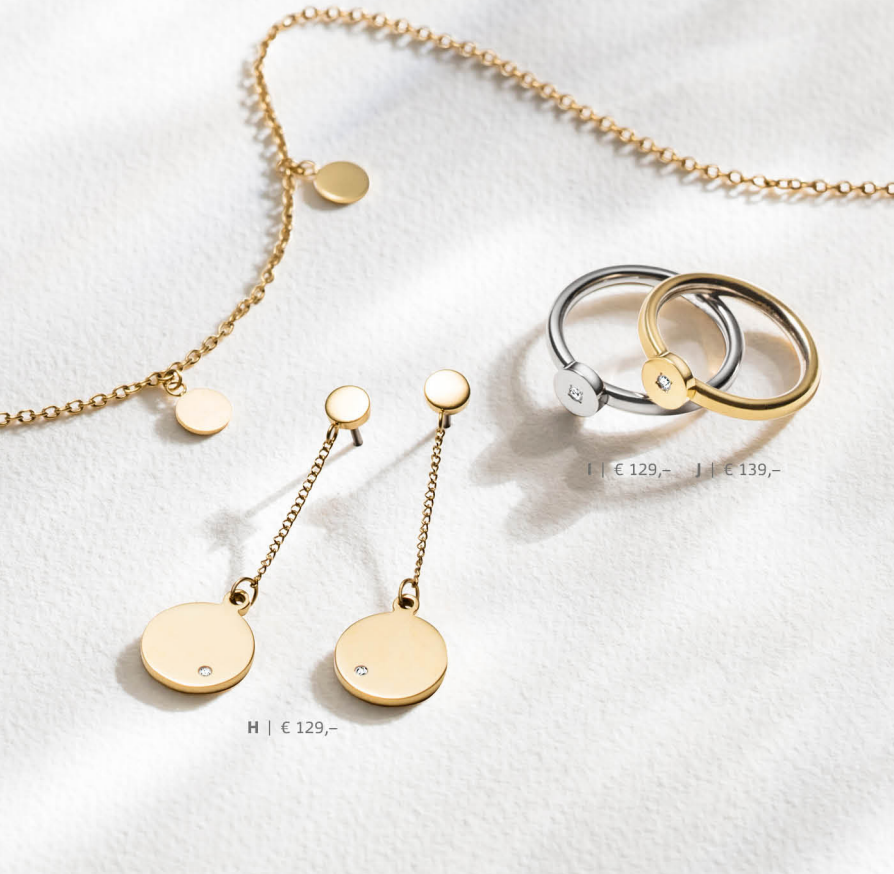
H | € 129,-