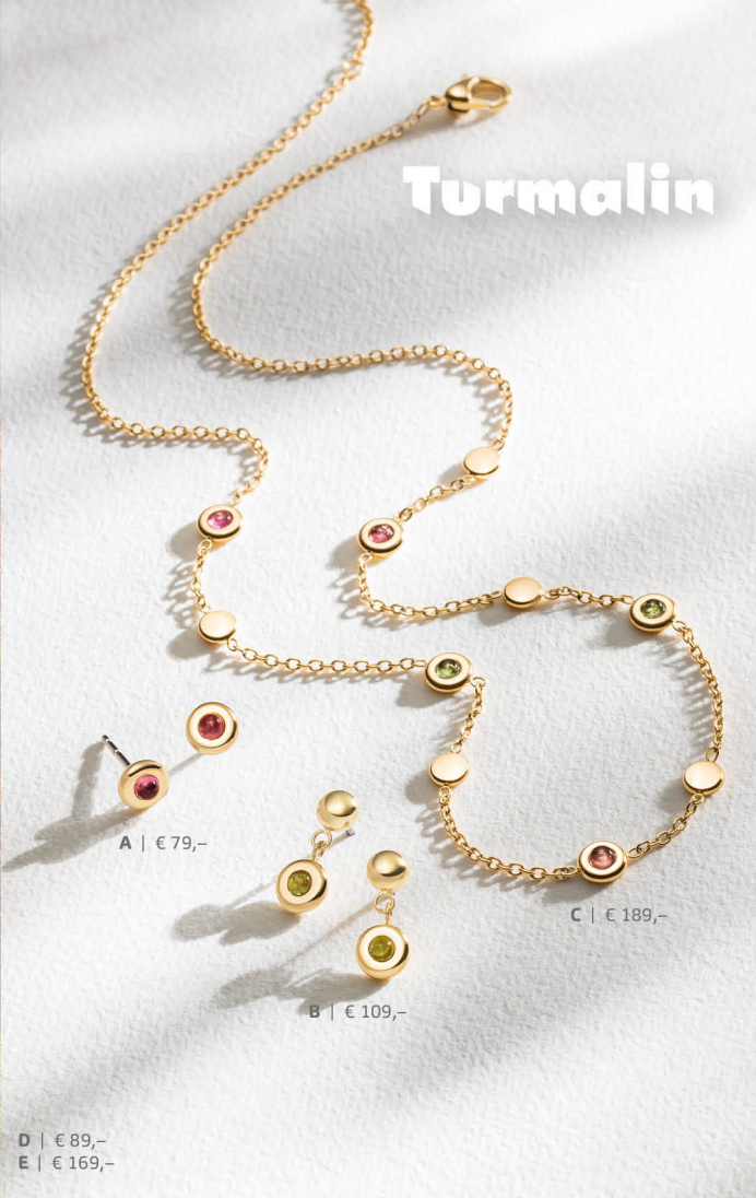
A | € 79,-