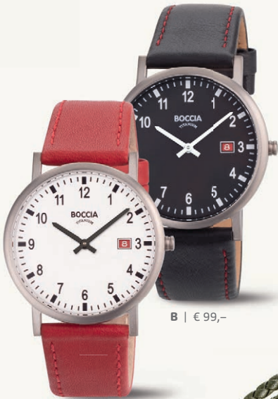
A | € 99,-