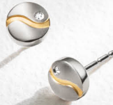
Q | € 129,-

A Collier 08046-03 Titan, 3 Brillanten 0,015 ct