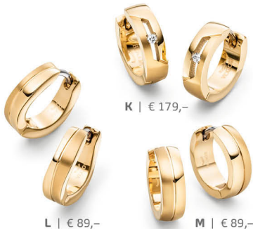
K | € 179,-