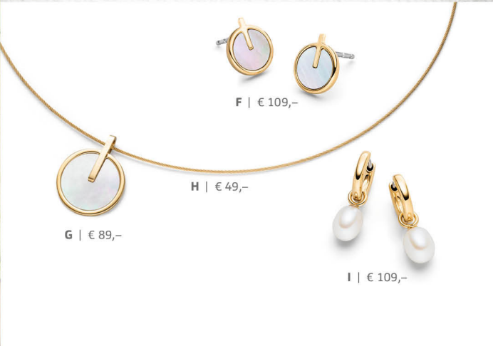
F | € 109,-