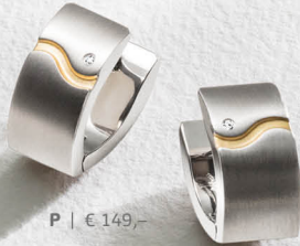
P | € 149,-