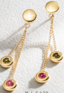
K | € 129,-

Der singhalesische Begriff tura mali steht für „Stein mit gemischten Farben“ und verweist auf das farblich faszinierende Spektrum des Farbedelsteins Turmalin.