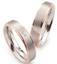
K | € 119,-