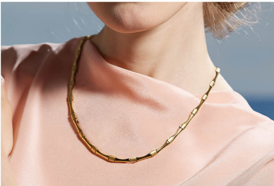
O | € 169,-

A Ohrstecker 05053-05 Titan, 2 Turmaline ca. 0,3 ct/Paar