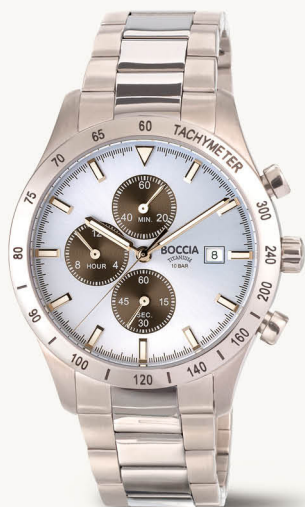
E | € 149,-

Natürlich nordisch - klares Design und pure Formen prägen den Look dieser spannenden Uhren- und Schmuck-Kollektion in Reintitan. Hochwertig und hautsympathisch. Von internationalen Designern entwickelt für dauerhafte Gültigkeit und ein gutes Tragegefühl.