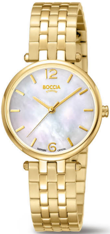
B | € 169,-