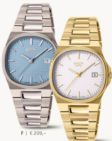
F | € 209,-