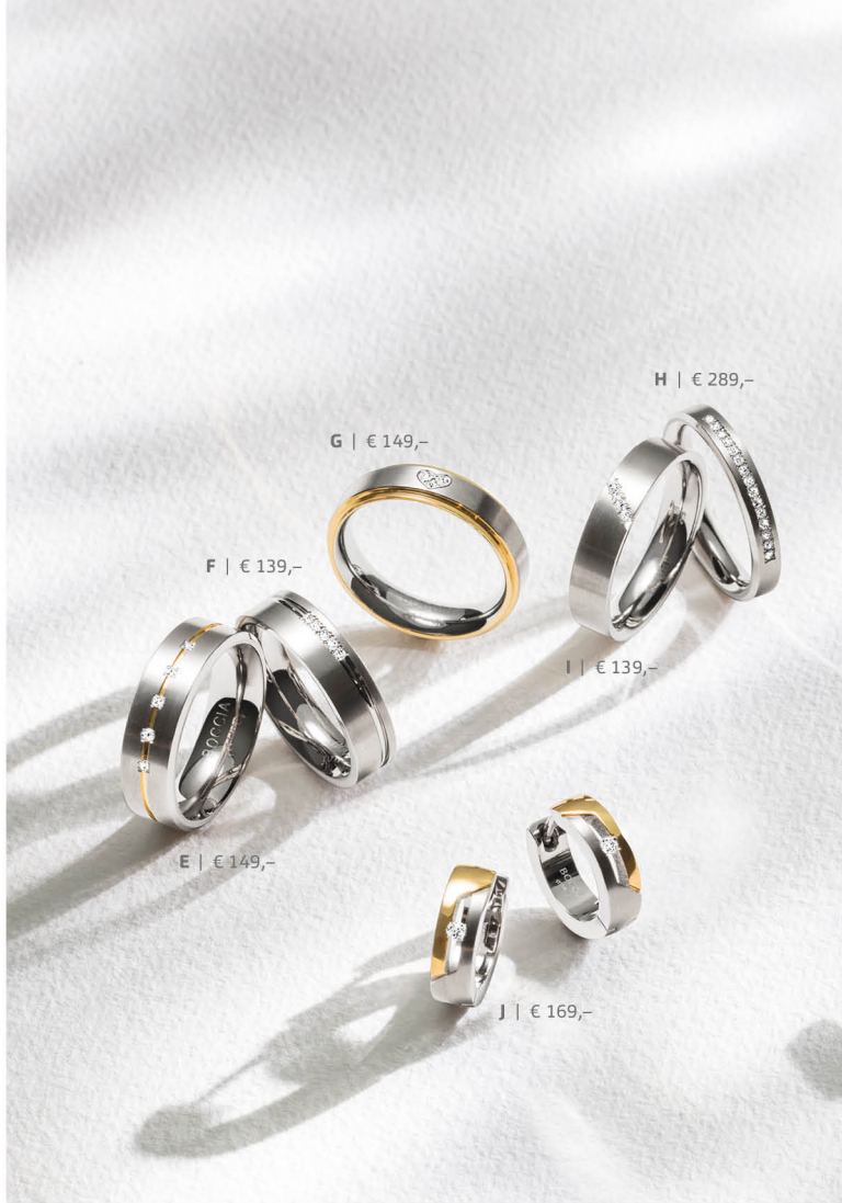
H | € 289,-