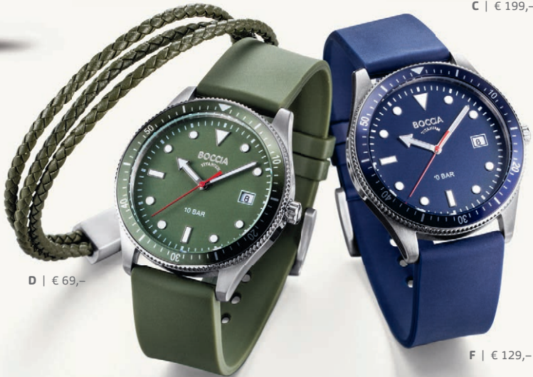
D | € 69,-