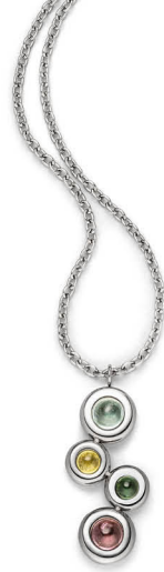
L | € 169,-

Der singhalesische Begriff tura mali steht für „Stein mit gemischten Farben“ und verweist auf das farblich faszinierende Spektrum des Farbedelsteins Turmalin.