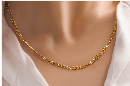
N | € 179,-

Alle Preise sind unverbindliche Preisempfehlungen.