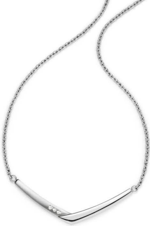
A | € 149,-