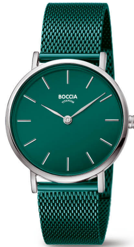
N | € 119,-