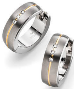
D | € 179,-