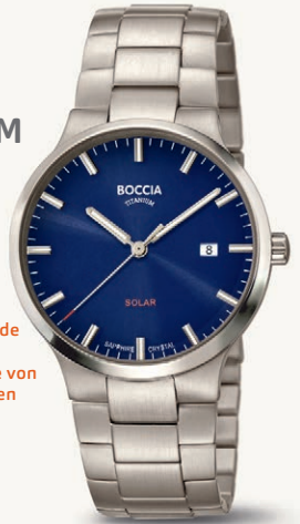
C | € 199,-