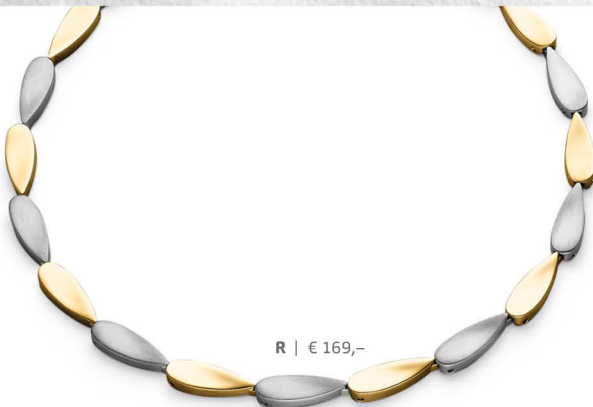
R | € 169,-